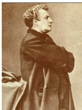
Рисунок 5. Фотография Жюль Верна

Интересно, что Э.Риу придал профессору Аронаксу, от имени которого ведется повествование, портретное сходство с Жюль Верном (см. рисунки 5 и 6). Профессор не сумел разгадать тайны капитана Немо, ибо в нем писатель воплотил обобщенный образ человека, гражданина мира, восставшего против несправедливости и тирании в обществе.