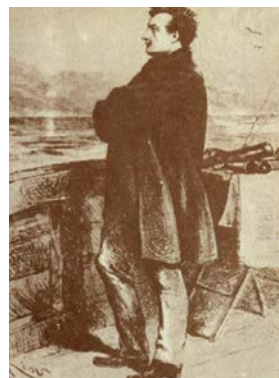
Рисунок 6. Профессор Аронакс